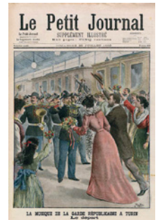
2 La Musique de la Garde à Turin, couverture du Petit Journal du dimanche 20 juillet 1902

2. Ce disque comportait La Marche des fiançailles de Lohengrin et la Marche de Tannhäuser