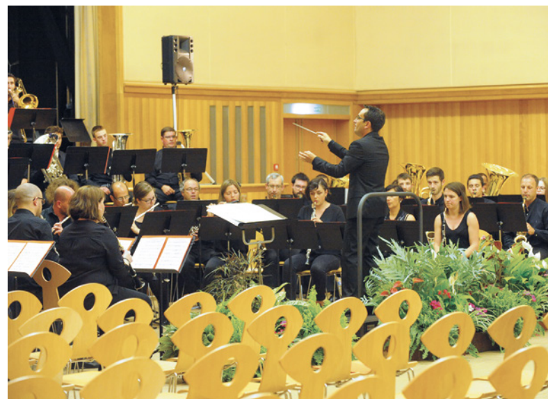
3 Concours national de Bouzonville 4 Concours national pour orchestre d'harmonie de Saint-Pierre-des-Corps

Durant ce concours, les orchestres ont pu être jugés et recevoir les conseils de jurys professionnels composés de :