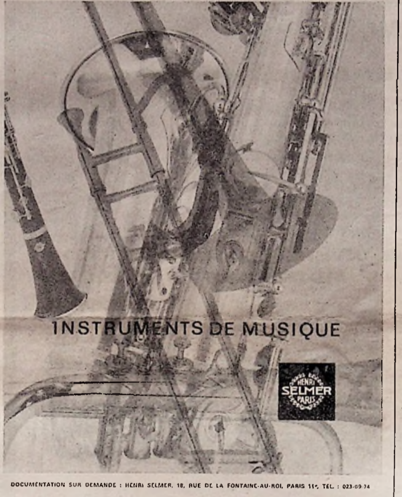
DOCUMENTATION SUR DEMANDE : HENRI SELMER, 18, RUE DE LA FONTAINE-AU-ROI, PARIS 11 e , TEL. : 023-09 74