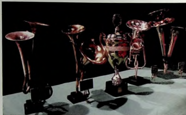
Les trophées remis aux vainqueurs du championnat

Les Brass bands qui ont obtenu le plus de points dans leur catégorie se sont vus remettre un trophée élaboré par l'artiste Johann Middelmann ( yo.han.free.fr ) à partir de rebus d'instruments de la marque Besson. Ils ont également reçu un bon d'achat des éditions De Haske pour une partition Brass Band.