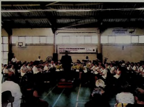
L'orchestre du stage 2010