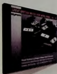
1. Great British Music for Wind band, vol. 16