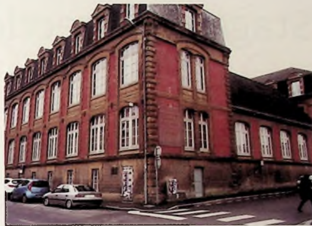
Conservatoire à Rayonnement Départemental de Charleville-Mézières

des classes d'éveil musical et de danse dès l'âge de 4 ans, de formation musicale, d'apprentissage instrumental de tous niveaux, d'écriture musicale et de composition, des formations de pratique collective (chorales d'enfants, ensembles de musique de chambre variés, orchestre à vent junior, orchestre symphonique, ateliers jazz, big band, de musiques du monde, de musiques actuelles). Les adultes (environ 20%) sont également admis à suivre ces enseignements donnés par 45 professeurs (fait rarissime: un grand nombre d'entre eux ont été élèves dans cet établissement et ont souhaité revenir y enseigner). Une caractéristique pour cette «École Nationale de Musique et de Danse» devenue «Conservatoire»: depuis octobre 1985, le même directeur! M. Dan Mercureau, qui dirige également l'Harmonie Municipale de Charleville-Mézières. Il a su insuffler une âme, une vie musicale intense, palpable à qui entre dans cet espace bien