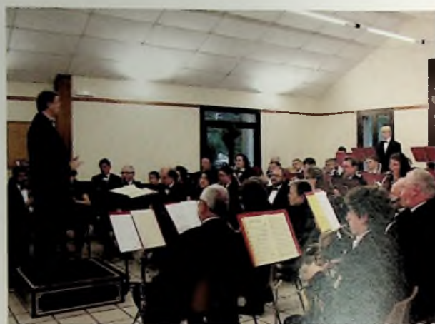
L'orchestre Alerte en concert à Troyes

C'est donc quelque 70 stagiaires instrumentistes qui travaillent en cours individuels, en ensembles inter-classes, en formation de musique de chambre et constituent l'orchestre d'harmonie, une dizaine de stagiaires en direction et 17 formateurs qui se retrouvent chaque année à la fin août.