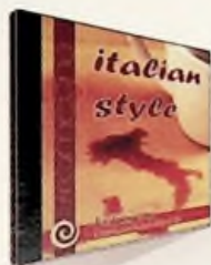
4. Italian Style