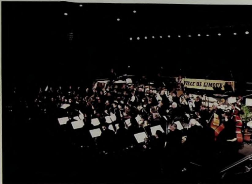
La Lyre municipale de Limoux, lors du concert de nouvel an.