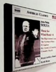
3. John Philip Sousa Music for Wind Band, vol. 8