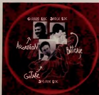
Nahia , Pygmalion.