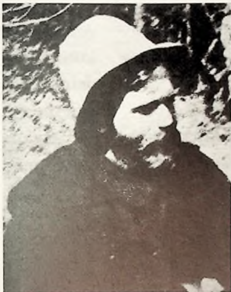
Zoltán Kodály vers 1910.

En 1955, lors d'un nouveau séjour en Hongrie, je rendis visite à Zoltán Kodály en vue d'une interview pour Les Lettres Françaises. Cela se passait à l'Académie des Sciences de Budapest dans son bureau dont les fenêtres s'ouvraient sur le Danube.