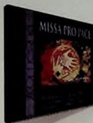
2. Missa Pro Pace