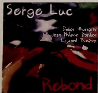
Rebond , ABS Bellissima.