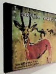
5. Olivier Calmel