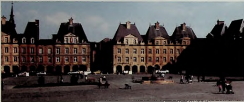
Place ducale de Charleville-Mézières.

Les 29 et 30 avril 2011 à Charleville-Mézières