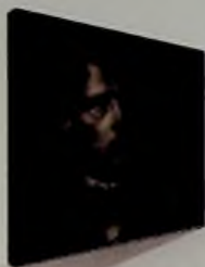
3. Hans Knappertsbusch