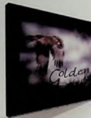
8. Golden Eagle