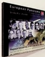
5. European Panorama