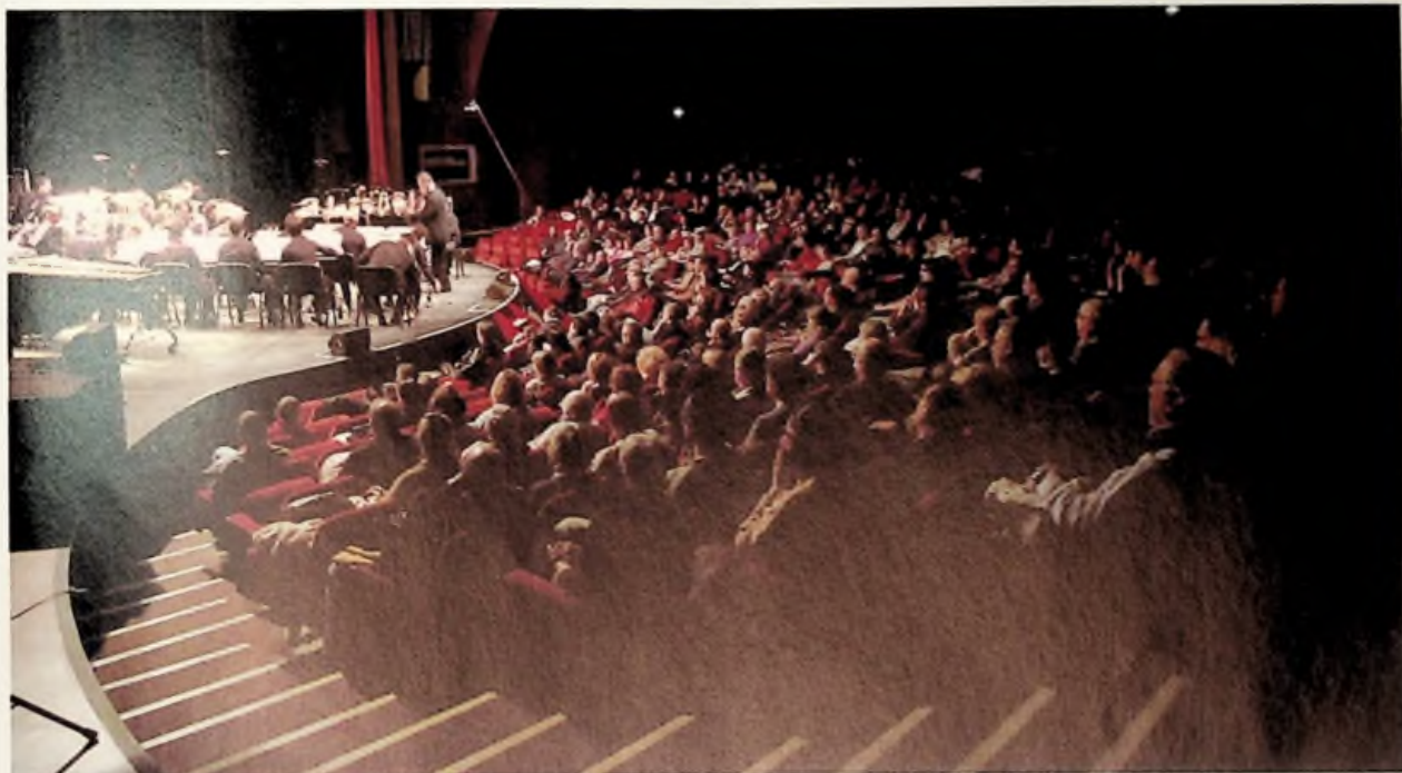
L'Auditorium Jules Verne lors du déroulement du championnat national de Brass Band

Décentralisé pour la seconde fois à Amiens, le Championnat National de Brass Band a accueilli le 30 janvier dernier les brass bands français, y compris les orchestres non affiliés à la Confédération Musicale de France qui ont pu se confronter à cette occasion avec les sociétés musicales du réseau. Pour cette 7 e édition, douze formations étaient en lice, sur le site Mégacité, Parc des expositions à Amiens.