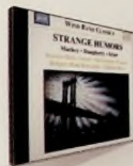
6. Strange Humors

par la musique militaire britannique Royal Artillery Band, placée sous la direction du spécialiste américain Keith Brion. Hormis les marches connues telles The High School Cadets (1890), Crusader March (1888), Jack Tar et The Washington Post (1889) et les marches moins connues telles Boy Scouts of America (1916), Comrades of the Legion (1920), On the Campus avec chant (1920), The Northern Pines (1931) et Pride of Pittsburgh (1901), il y a une sélection de l'opérette El Capitan (1895) avec l'air O Warrior Grim pour trompette solo et la très belle suite At the King's Court (À la cour du roi) (1889), écrite pour la tournée de l'Orchestre Sousa en 1905 en Angleterre, où le «Roi de la Marche» se produisit effectivement à la cour. Les trois parties sont intitulées : «Madame la Comtesse», «Sa Grâce la Duchesse», «Sa Majesté la Reine». Sousa était un compositeur qui maniait aussi l'humour dans ses orchestrations. Un vrai régal. ■