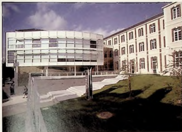
Conservatoire à Rayonnement Départemental de Troyes