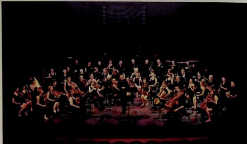
l'Orchestre symphonique de l'Harmonie de Chabeuil en concert au Train théâtre de Portes-lès-Valence

site aussi bien musicalement que socialement. Pour la saison 2013/2014, l'ambition est de proposer un concert accessible à tous associant l'Orchestre symphonique à une chorale d'enfants dans une grande salle de la région valentinoise.