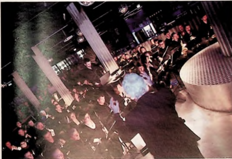
L'Electro Wind Band au Magazine Club de Lille

avec Monoblok et l'Orchestre d'Harmonie de Lille-Fives