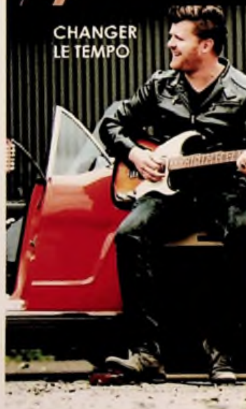
CHANGER LE TEMPO