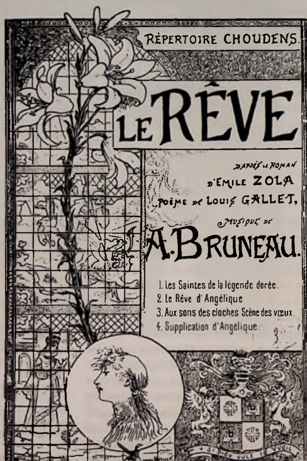
Le Rêve , Alfred Bruneau, d'après Émile Zola, éditions Choudens.