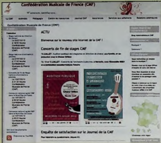
Le site CMF, vu par tous