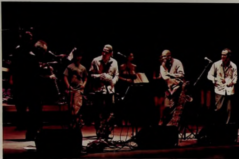
Orchestre d'harmonie de la creuse

liers d'improvisation et était le prétexte à la création de Big Meat , une fresque ambitieuse pour orchestre d'harmonie, big-band et saxophoniste improvisateur. Cette dernière partie était tenue par le compositeur Michael Alizon lui-même.