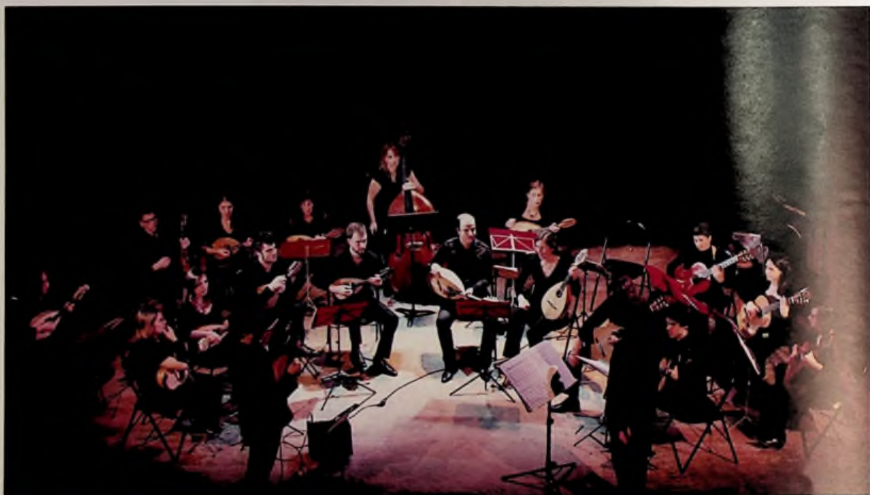
L'ensemble MG21 en concert

Pour la 4 e session du Stage national d'orchestre à plectres dans le cadre de Marseille capitale européenne de la Culture