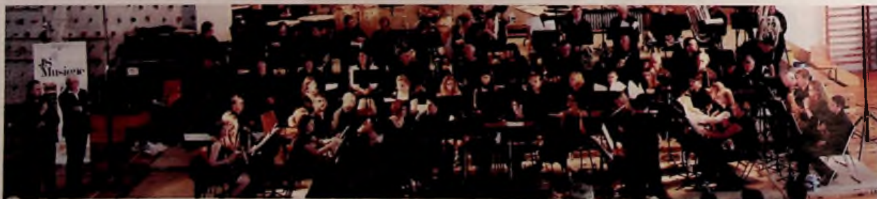
L'Ensemble musical de Quincieux

Fort de la réussite de ce week-end de musique, les sections chorales et harmonie de l'Ensemble musical de Quincieux peuvent continuer d'organiser de nouvelles rencontres musicales, et l'année 2014 sera celle du 130 e anniversaire avec un certain nombre de festivités musicales au rendez-vous pour fêter l'événement.