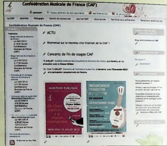
Le site CMF, lorsque l'administrateur est connecté