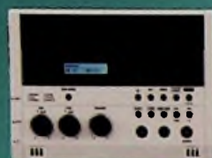
SD-2U • SD ONLY

Questions, renseignements ou problèmes techniques: Pôle Culturel Ev@sion tel: 05 56 77 36 26 Télécharger le logiciel gratuitement http://evasion.ville-ambares-etlagrave.fr/orchestre-virtuel/vatlon numerique .