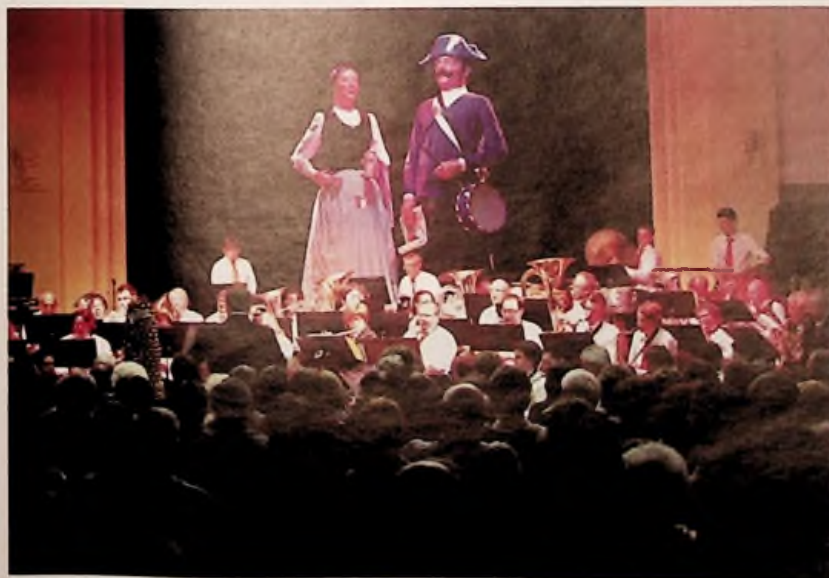
Orchestre d'harmonie de la Concorde pour la création de Terre de Géants

Les objectifs à atteindre étaient multiples pour l'orchestre: créer une mixité en associant musiciens amateurs, élèves de l'école de musique et musiciens professionnels; innover en accompagnant des solistes d'instruments de musiques actuelles (guitare électrique, batterie, contrebasse) et d'instruments traditionnels (flûte de pan, harpe...); rendre le spectacle accessible à tous, adapté à tous les âges et à un prix abordable. Grâce au soutien financier, ce spectacle a été une réus-