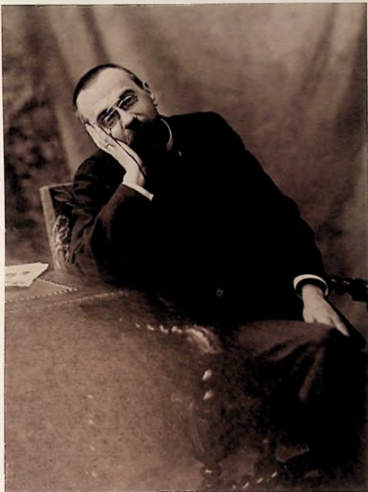
Alfred Bruneau, 1891.

Un an après cette publication décisive, c'était le 50 e anniversaire de la mort d'Alfred Bruneau. On rediffusa l'émission de 1957 où avait été donné en