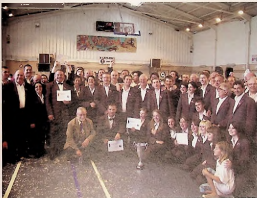
L'Orchestre la Jeanne d'Arc, récompensé après le concours.