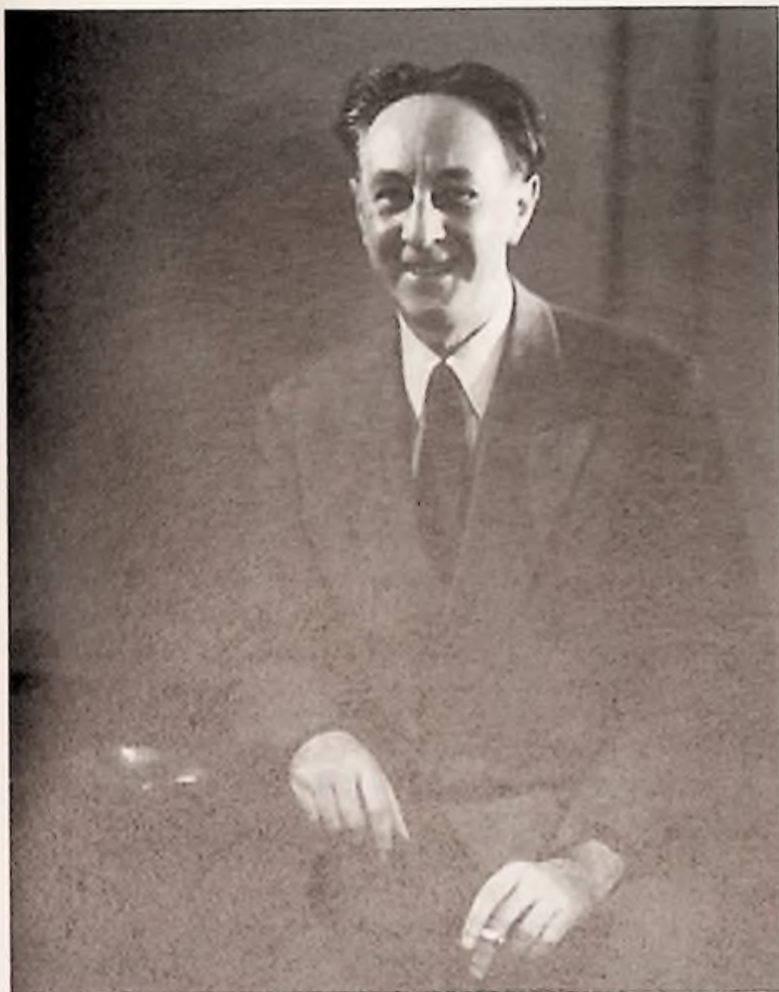
Bohuslav Martinu en 1945